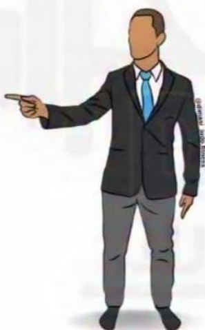
SHIDO/ HANSOKU MAKE