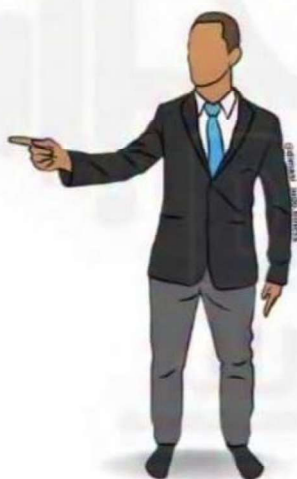
SHIDO/ HANSOKU MAKE